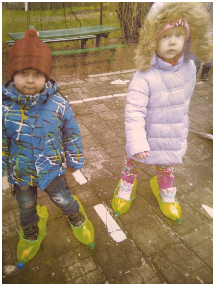
Вторая жизнь бутылок