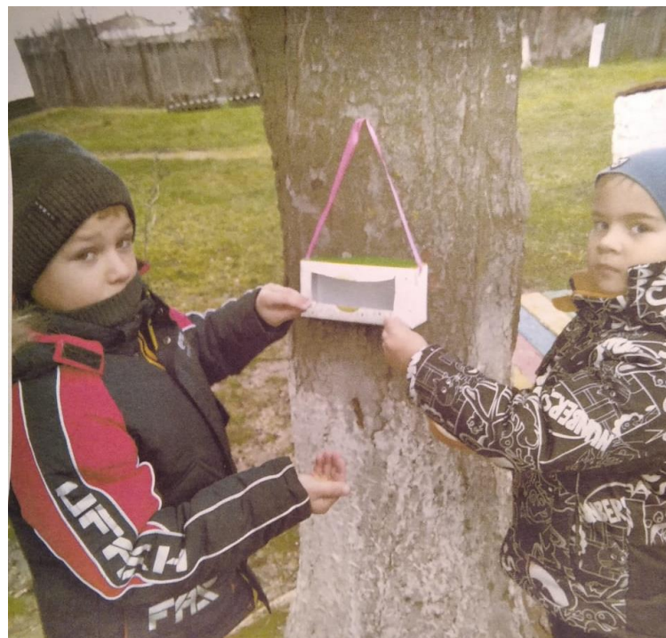
«Сок мы выпили в обед и для птиц готов буфе»