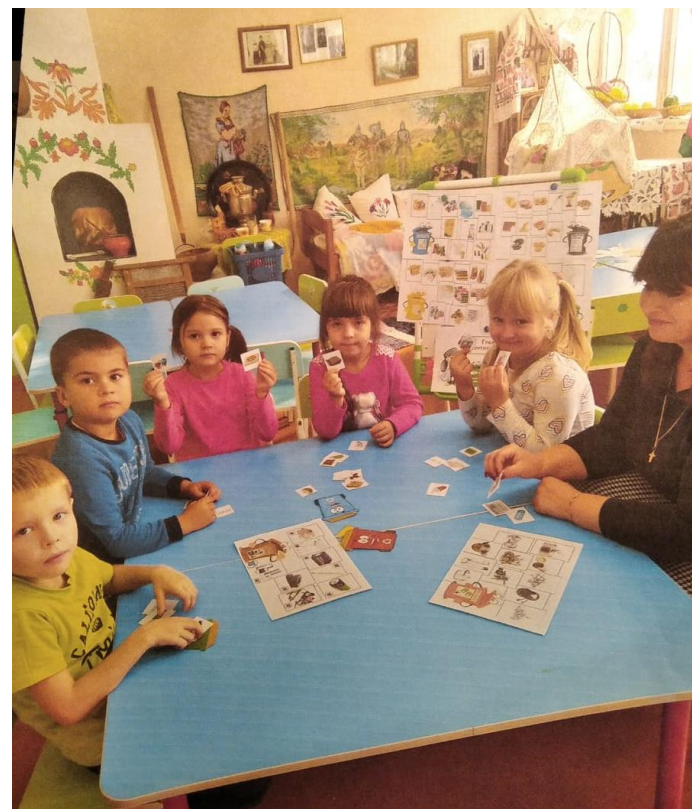
Учимся сортировать мусор