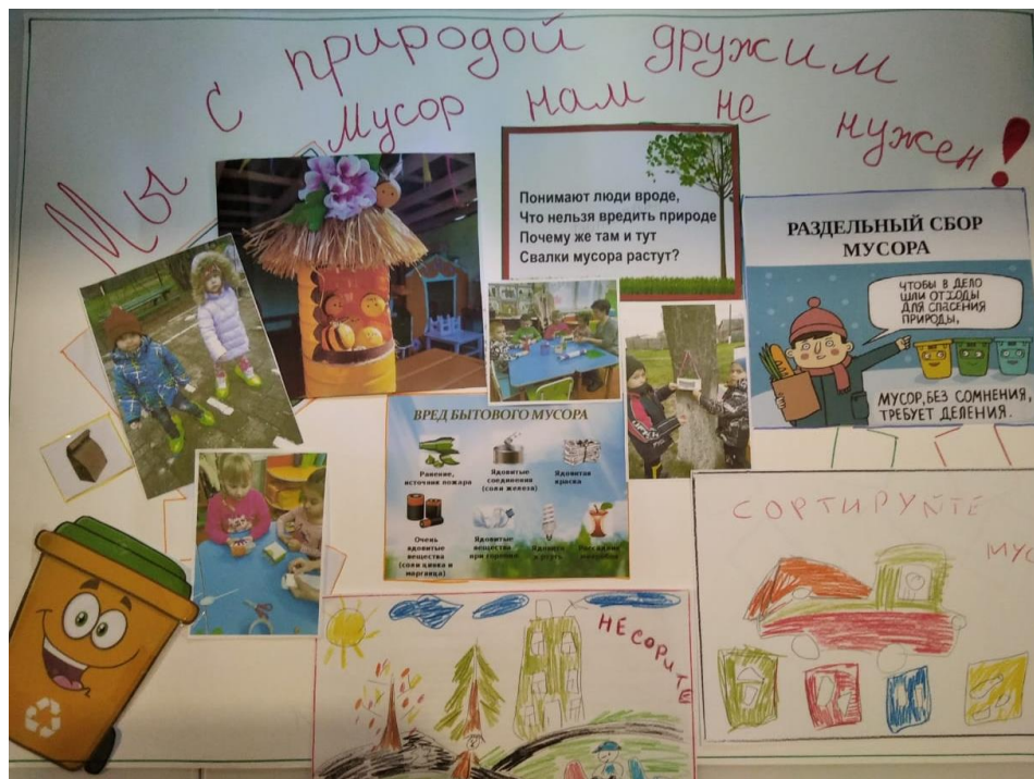
Стенгазета: «Мы с природой дружим мусор нам не нужен!»